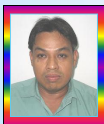
สมนึกชาติทรัพย์สิน กรรมการ