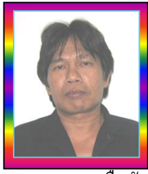
ชลด(ทยากร) เสือหัน กรรมการ